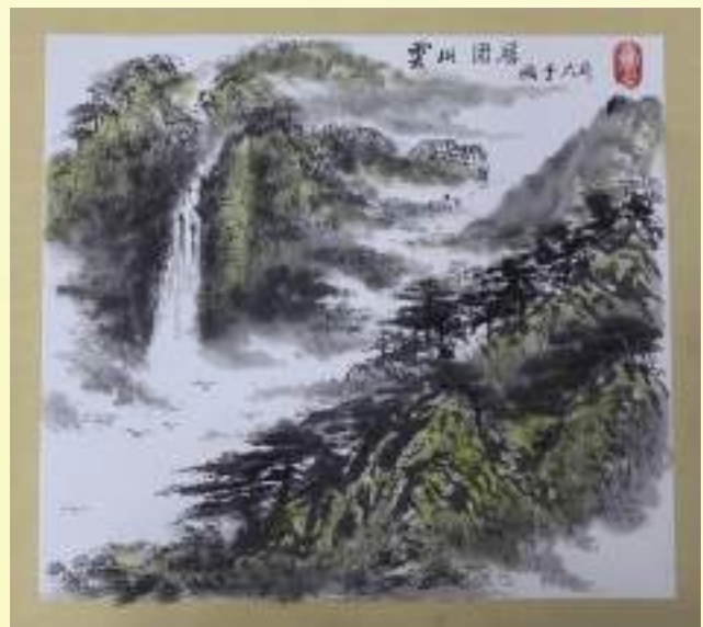
孔宪玉《云山固居》绘画类第三名